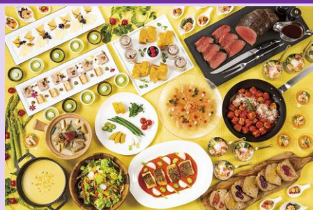
＜写真は、イメージです。＞

必ず、事前に予約をお願いします。(駐車場3時間まで無料) TEL【042-656-6721】(予約受付10:00~18:00)