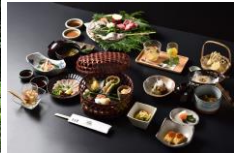
＜写真は、イメージです。＞