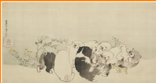
長沢芦雪《菊花子犬図》個人蔵