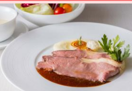
平日限定ローストビーフセット ＜イメージ＞